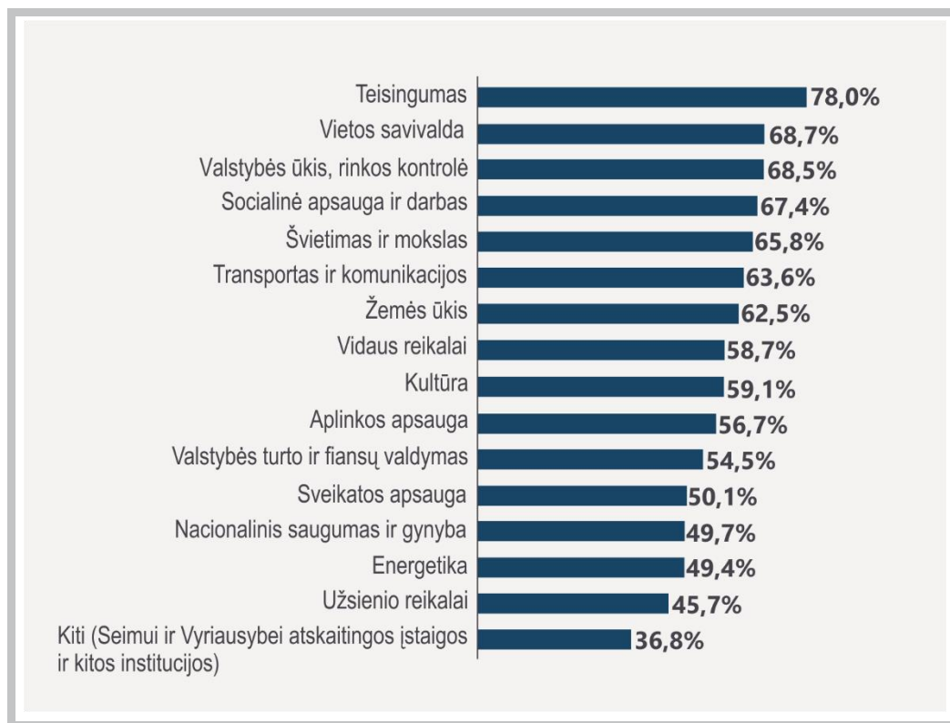
3 pav. 2010–2016 m. I pusm. Teiktos ir laiku įgyvendintos rekomendacijos (proc.)