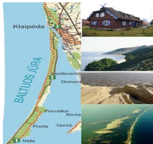
1 pav. Kuršių nerijos teritorija

Kuršių nerijos teritorijos subalansuotas naudojimas visuomenės ir valstybės reikmėms suprantamas kaip sudarymas sąlygų visuomenei naudotis šios teritorijos rekreaciniais ištekliais, gamtos ir kultūros vertybių paveldu ir viso to suderinimas su apsaugos priemonių įgyvendinimu. Dėl to Kuršių nerijos teritorijos subalansuotam naudojimui turi įtakos teritorijos planavimas, turizmo plėtra, gamtos ir kultūros vertybių apsauga. Būtent todėl šios teritorijos administravime dalyvauja skirtingi viešojo administravimo subjektai pagal jiems priskirtą kompetenciją: