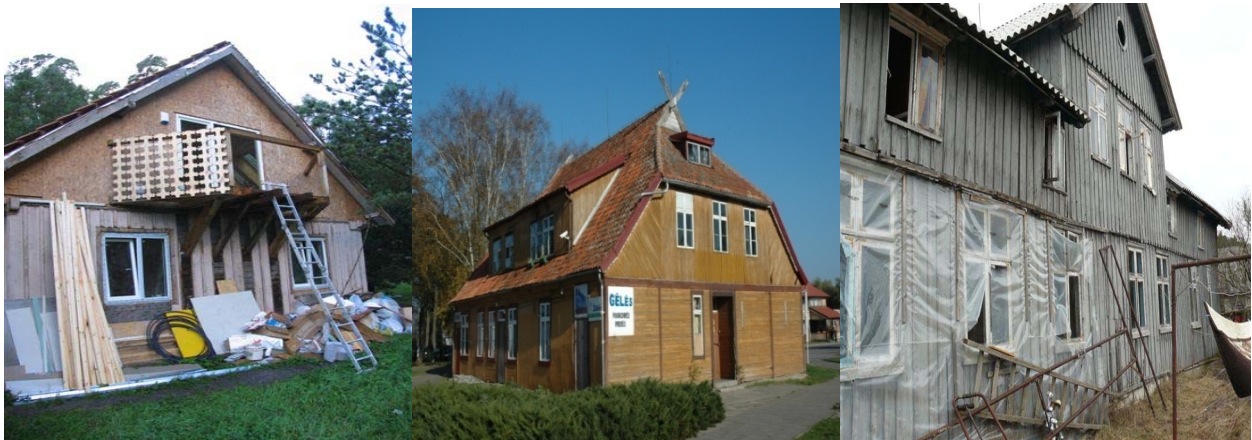
a) L. Rėzos g. 68