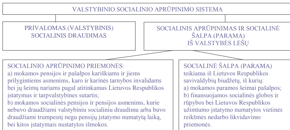
1 pav. Valstybinio socialinio aprūpinimo sistema pagal įstatymą

Valstybinio socialinio aprūpinimo santykių pagrindus reglamentuoja 1990 m. priimtas Valstybinio socialinio aprūpinimo sistemos pagrindų įstatymas 13 (toliau – Įstatymas). Jo 1 straipsnyje valstybinis socialinis aprūpinimas apibrėžtas kaip valstybės nustatytų socialinių ekonominių priemonių sistema, teikianti gyvenimui reikalingų lėšų ir paslaugų respublikos gyventojams, kurie negali dėl įstatymų numatytų priežasčių apsirūpinti iš darbo ir kitokių pajamų arba yra nepakankamai aprūpinti. Pagal įstatymą, valstybinio socialinio aprūpinimo sistemą sudaro: a) privalomasis (valstybinis) socialinis draudimas; b) socialinis aprūpinimas ir socialinė šalpa (parama) iš valstybės lėšų (1 pav.).