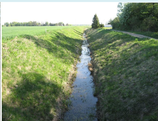
Prižiūrėtas melioracijos griovys