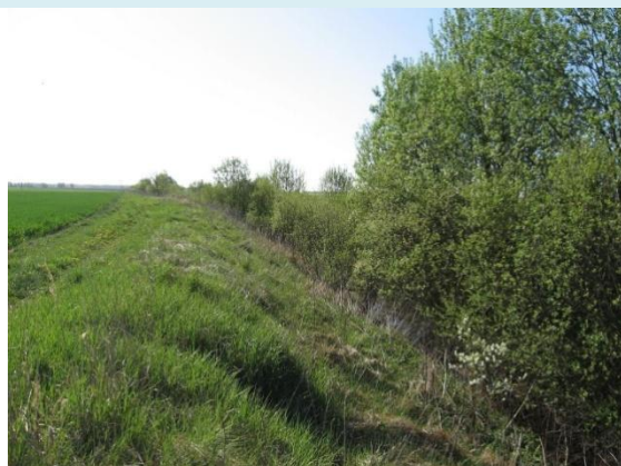
Nesutvarkytas melioracijos griovys